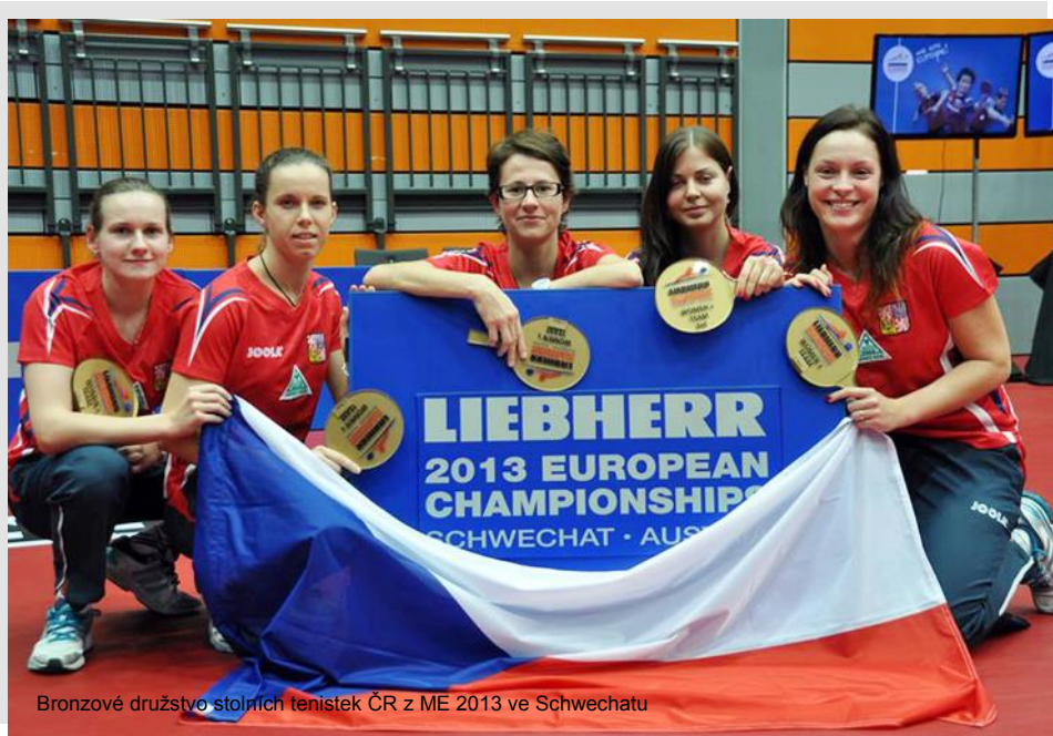
Bronzové družstvo stolních tenistek ČR z ME 2013 ve Schwechatu

“Nápad na otevření Síně slávy českého stolního tenisu vznikl v mé hlavě po jedné návštěvě kolegů ze Slovenského stolnotenisového svazu. Se svolením generálního sekretáře Antona Hamrana jsem tedy použil základní myšlenky a návody, jak Síň slávy českého stolního tenisu založit. Dlouho jsme zvažovali vhodný termín pro tento slavnostní akt. Nakonec se otevření Síně slávy uskutečnilo v rámci oslav