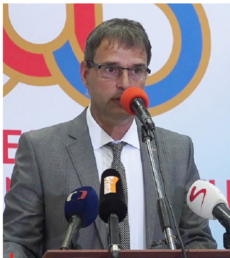
Marek Hájek, místopředseda České unie sportu

Přitom sportovní kluby a tělovýchovné jednoty služby, které zajišťuje 89 Servisních center sportu ČUS, potřebují a také ve vysoké míře využívají. Nedávný exkluzivní výzkum ČUS potvrdil, že se to týká 86% sportovních klubů a tělovýchovných jednot. Role SCS ČUS je v tomto případě nenahraditelná, neboť klubům a jednotám poskytují například administrativní a ekonomický servis (dotace, účetnictví, správu informačního systému ČUS, metodiky atd.), podílejí se na vzdělávání