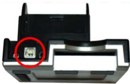
PM3 & PM4