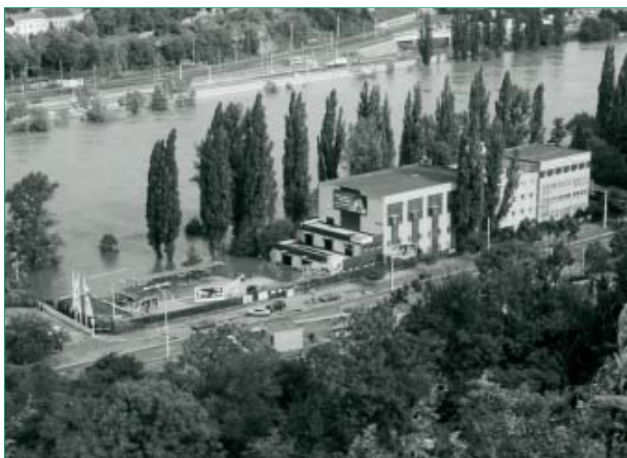
13. srpna 2002, loděnice Bohemians Praha