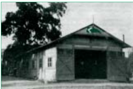
Původní loděnice Vinohradských veslařů

Po prvé startovali libeňští veslaři na Primátorkách v roce 1934, bohužel neúspěšně. Háček hned po startu zlomil veslo a tato nehoda vyřadila loď ze závodu. Osmá žen startovala v tomtéž roce v 1. ročníku Ženských osem a umístila se na druhém místě za ŽVK. Muži si neúspěšný start vynahradili již v roce příštím, kdy se umístili na čtvrtém místě.