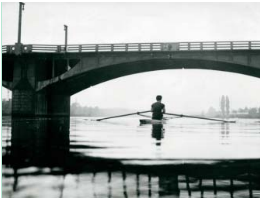
Pod Trojským mostem (mostem Barikádníků)