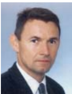
MUDr. Pavel Bém, primátor hlavního města Prahy

K pražskému závodě přeji všem osmám i ostatním účastníkům hodně štěstí a divákům neopakovatelný sportovní zážitek.