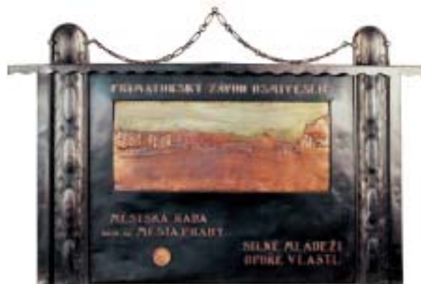
Primátorský štít s nápisem „Silné mládeži – opoře vlasti“ vytepal z mědi ciselér R. Schorcht podle návrhu arch. F. Kavalíra

Tradiční a populární zatáčka však nevydržela po celou dobu existence Primátorek. Již na počátku druhé světové války nastala odchylka. Start byl posunut k severnímu cípu dnešního Veslařského ostrova a cíl byl mezi mosty Palackého a Jiráskovým na úrovni loděnice VK Slavia – tzv. „dolní“ dráze. Primátorky sice přišly o svou zatáčku, zůstaly však přístupné obecnstvu. Horší následky mělo přesunutí závodu na „horní“ neboli „mistrovskou“ dráhu s cílem na Stadionu vodních sportů. Tam se jelo poprvé v roce 1959. Návrat na tradiční trať se uskutečnil v roce 1967, ovšem mezitím větší vzdálenost nové trati od centra města znamenala ztrátu publika, které se po osmi letech, i vzhledem ke změně životního stylu (volné soboty, chaty a chalupy), již nikdy na pražská nábřeží nevrátilo v původním počtu.