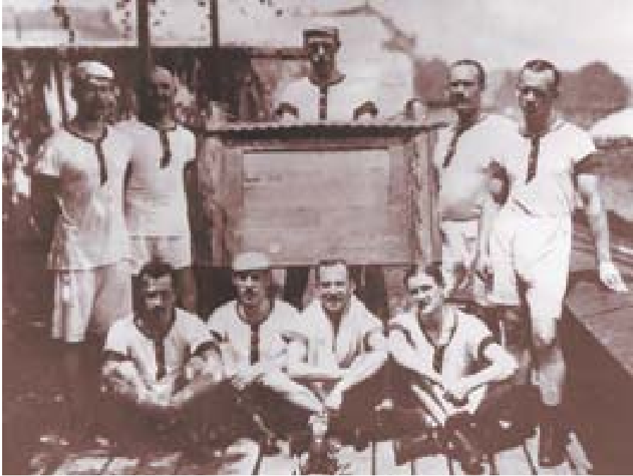
Osma VK Slavia Praha – vítěz 1. ročníku závodu Primátorských osmiveslic v roce 1910

vzhledem k zákazu veškerých sportovních akcí jelo teprve po prozrazení atentátníků a ukončení stanného práva – 25. července. Rovněž v roce 1945 konec války odsunul Primátorky z tradičního termínu až na červenec, a ČVK Praha tak prodloužilo svou vítěznou sérii až 15. července. Poválečná léta držela tradiční termín první dekády června, ovšem v padesátých letech přišel – jistě také z důvodu stále dřívějšího zahájení tréninku – posun na přelom května a června. Poslední víkend v květnu se závodilo takřka vždy od roku 1959 po celá 60. a téměř celá 70. léta. K zásadnímu přelomu došlo v roce 1979, kdy se jely Primátorky na sklonku září – 28. 9. a 29. 9. Závěr sezóny však vedl k tomu, že na některých ročnících chyběli nejlepší reprezentanti (dovolená), a pověst Primátorek tak utrpěla další šrámy. Jarní tradice byla obnovena v roce 1988 (pořadatel ČVK), což mělo souvislost s účastí na olympijských hrách v Soulu. Ty se konaly až na podzim, a tudíž byl dostatek času jak na reprezentační přípravu, tak na Primátorky. U tradičního jarního termínu se pak již zůstalo. Výjimečný ročník byl také v roce 1984 – to se kvůli pracovní sobotě jely Primátorky poprvé v novodobé historii v jednom dni. Proslulost závodu o Primátorský štít nepřináší jen dlouhá tradice, nýbrž také netradiční dráha se zatáčkou.