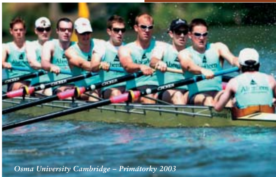
Osma University Cambridge – Primátorky 2003

„Silné mládeži – opoře vlasti“. Národní charakter závodu byl dán tehdejší situací, kdy český veslařský sport byl izolován od mezinárodní konkurence, což vedlo k pocitu omezení a ohrožení. Soutěž zůstala oficiálně uzavřena zahraničním sportovcům po dlouhá desetiletí. Ve skutečnosti však bylo heslo vytesané na putovní ceně hned ve druhém ročníku porušeno. Tehdy se objevil na startu první mimopražský klub – VK Jordán Tábor. Překvapil druhým místem a jednalo se vlastně i o mezinárodní premiéru v rámci Primátorek. Táborskou posádku totiž tvořili polští studenti místní hospodářské akademie. Oficiální porušení letitého „tabu“ se událo až v roce 1995. Pod vlivem stabilní převahy veslařů Dukly, snižujícího se počtu posádek a ve shodě se snahou učinit soutěž atraktivnější pro závodníky, diváky, média i sponzory, byl na dobu pěti let schválen revoluční návrh na otevření Primátorek zahraničním posádkám. Loňského 90. ročníku Primátorek se mimo jiné zúčastnila také osma Cambridge University Boat Club, účastník již 150. ročníku slavného závodu Oxford-Cambridge. Po strhujícím boji s oddílovou posádkou pražské Slavie nakonec angličtí veslaři odešli poraženi a ve finále obsadili páté místo. Věříme, že účast zahraničních posádek přispěje i letos ke zvýšení sportovní úrovně závodu.